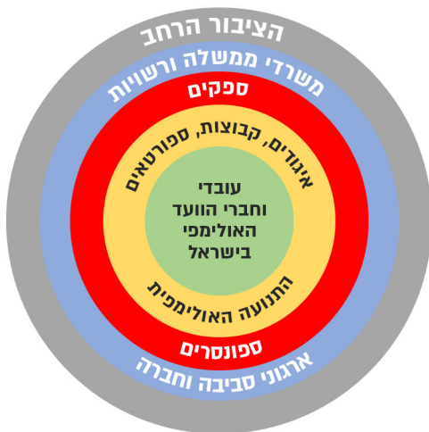
איור מס' 1: מיפוי מחזיקי עניין

פיתוח ויישום אסטרטגיית קיימות מחייב שיתוף פעולה עם בעלי עניין שונים, פנימיים וחיצוניים, שפועלים באופן ישיר ועקיף עם הוועד האולימפי בישראל (איור מס' 2). מיפוי בעלי העניין יאפשר העברת ידע ולמידת עמיתים ויצירת שיתופי פעולה, שבתמורה יאפשרו לקדם את המטרות ואת היעדים של התוכנית האסטרטגית ולהבטיח את יישומה. השותפים הישירים והמידיים של הוועד האולימפי בישראל הם עובדי וחברי הוועד, האיגודים, הקבוצות והספורטאים האולימפיים, ולצידם גם הוועד האולימפי הבין-לאומי וועדים אולימפיים וגופי ספורט מקבילים בעולם. מעגל נוסף של בעלי עניין כולל גופים שתורמים לוועד האולימפי ולאגודים השונים וספונסרים של הקבוצות והספורטאים וכן ספקים המספקים לוועד האולימפי ולאגודות מוצרים ושירותים, למשל בתחום אירועי ספורט או יחסי ציבור. מעגל נוסף מתייחס למשרדי ממשלה העוסקים בתחומי הספורט והקיימות, ובפרט משרד התרבות והספורט, משרד החינוך והמשרד להגנת הסביבה, רשויות לאומיות ומקומיות וארגוני גופי סביבה וחברה שונים בישראל. לבסוף, פעילות הוועד האולימפי בישראל משפיעה במעגל החיצוני על ספורטאים רבים ועל הציבור הרחב, ויש לה נגיעה לתקשורת הארצית והעולמית.