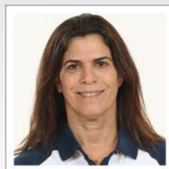
יעל ארד יו"ר חברת ה-IOC Yael Arad President IOC Member