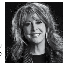
ננסי ליברמן, כדורסלנית אולימפית ומאמנת בליגת ה-WNBA

This trend can be divided into five main periods. The first was the early days of the modern Olympic movement when female participation in the Games was prohibited, or was allowed only in limited areas, for medical or cultural reasons. The second period, between the two world wars, when women received political rights in most of the western countries, there was an increase in participation of women in many different branches of sports, though not in branches requiring extreme physical exertion and which were associated exclusively as "male sports". The third period was during the 50s and the 60s, when sport was used as a political tool during the Cold War, and propelled by the increase in the percentage of women participants. The fourth period, in the 70s and the 80s, marks the breaking of sport boundaries, such as in marathon races, ball games, etc., as a result of struggles for gender equality in the 60s. The last period, from the end of the 20th century until the present day relates to the commercialization of sport, which increased the popularity of women's sports, while completely ignoring those reasons that had limited women's participation in sports more than 100 years ago.